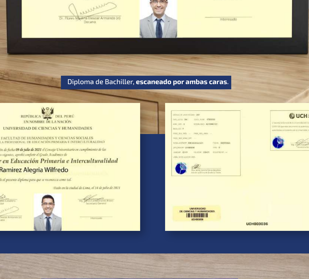
Diploma de Bachiller, escaneado por ambas caras.