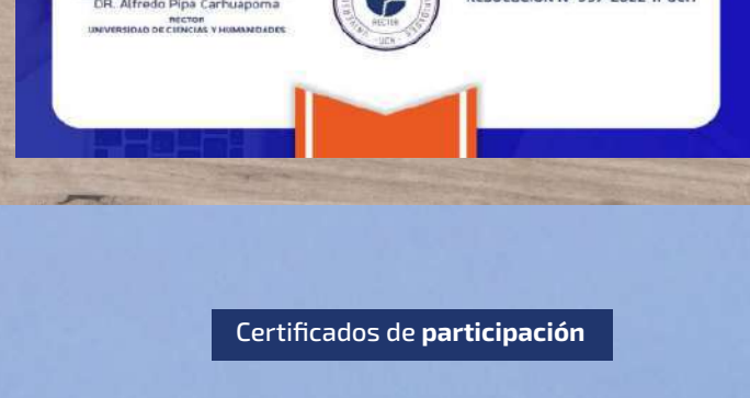
Constancia in calidad de ponente